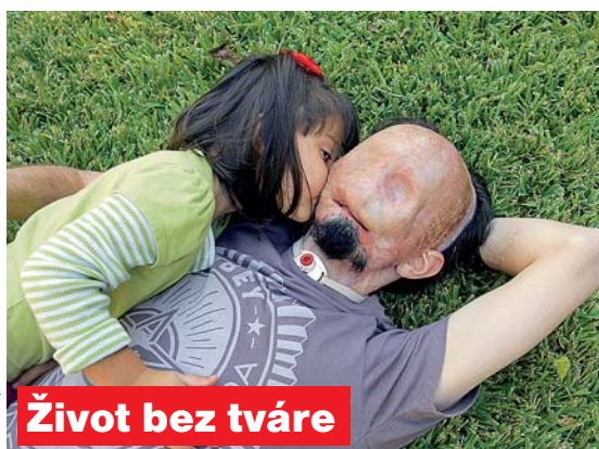
Život bez tváre